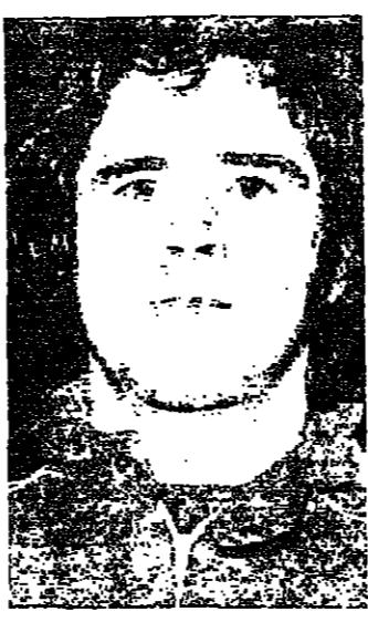
بيليه برك سانتوس والبرازيل ولكنه لم يتخل عن رغبته الشهيرة